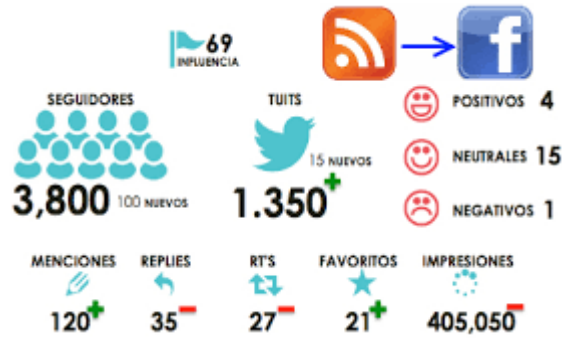
Ejemplo de resultado en pantalla de monitoreo de red social