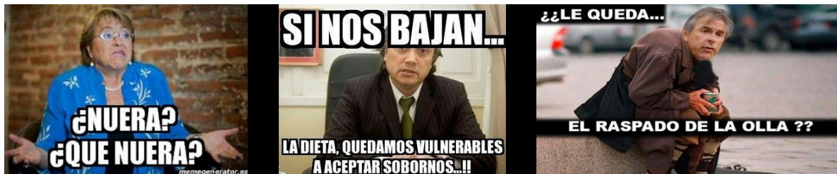
Memes políticos chilenos extraídos en páginas de libre acceso a través de google.cl

Subcategoría acción política virtual debe entenderse toda acción de intercambio de opinión, análisis, discusión, integración de meme , 33 comentario, u otro, que señala una intencionalidad de apoyo o rechazo político determinado, e indica necesariamente una postura ideológica al respecto.